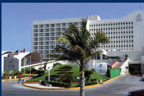
Hôtels, Villages et clubs de vacances