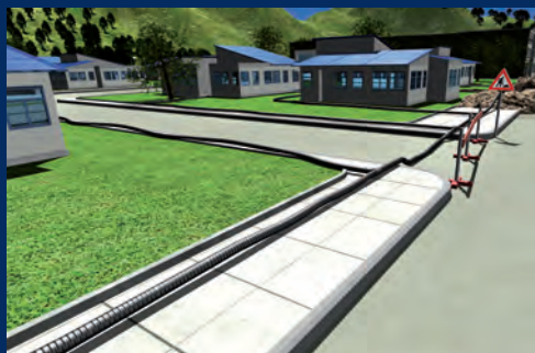
Réseaux de chaleur et/ou de froid