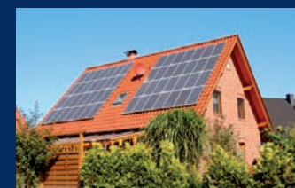
Tubes pour systèmes solaires