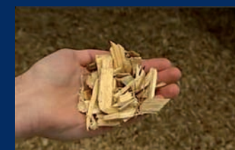
Distribution de chaleur pour les centrales à biomasse