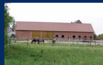
Applications eau froide