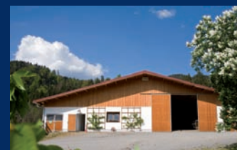
Chauffage pour écuries