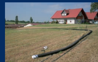
Réseaux de chaleur pour les bâtiments résidentiels