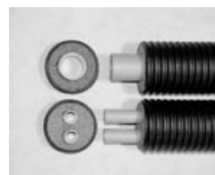
Figure 1 : Flexalen 500/600

Le principe des systèmes FLEXALEN 500/600 et FLEXALEN 1000+ est de protéger la canalisation en PB par une gaine étanche en polyoléfine haute densité. Entre la gaine et le tube caloporteur l'isolation est réalisée par une mousse isolante en polyoléfine. Le ou les tubes en PB sont enrobés directement au contact de l'isolant pour le système 500/600 et restent libres pour le système 1000+ (lignes multiples à 3, 4 tubes ou plus).