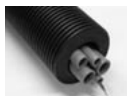
Figure 2 : Flexalen 1000+