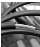
Figure 4 : Flexalen 60

Le système FLEXALEN 60 est un tube PB préisolé par un manchon continu en mousse de polyoléfine