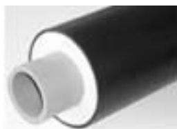
Figure 3 : Flexalen 1000

Le système FLEXALEN Barres droites est constitué de tubes PB en longueurs droites dont l'isolation est en mousse polyuréthane injectée.